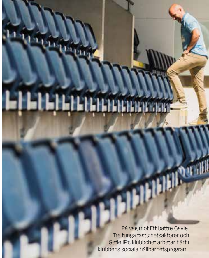
På väg mot Ett bättre Gävle. Tre tunga fastighetsaktörer och Gefle IF:s klubbchef arbetar hårt i klubbens sociala hållbarhetsprogram.