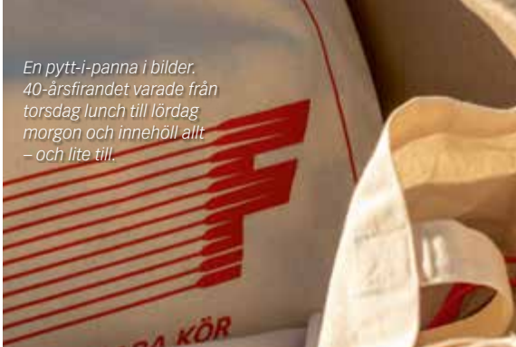
En pytt-i-panna i bilder. 40-årsfirandet varade från torsdag lunch till lördag morgon och innehöll allt - och lite till.